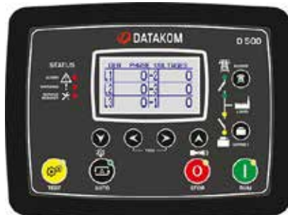
D-500LITE MK2 kontrol paneli