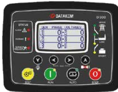
D-500 MK2 kontrol paneli