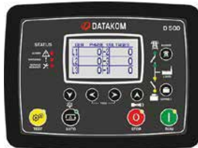
D-500LITE MK2 kontrol paneli