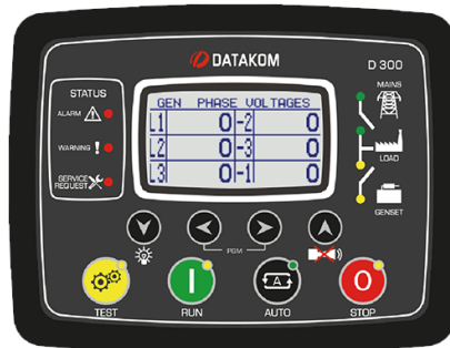
D-300 MK2 kontrol paneli